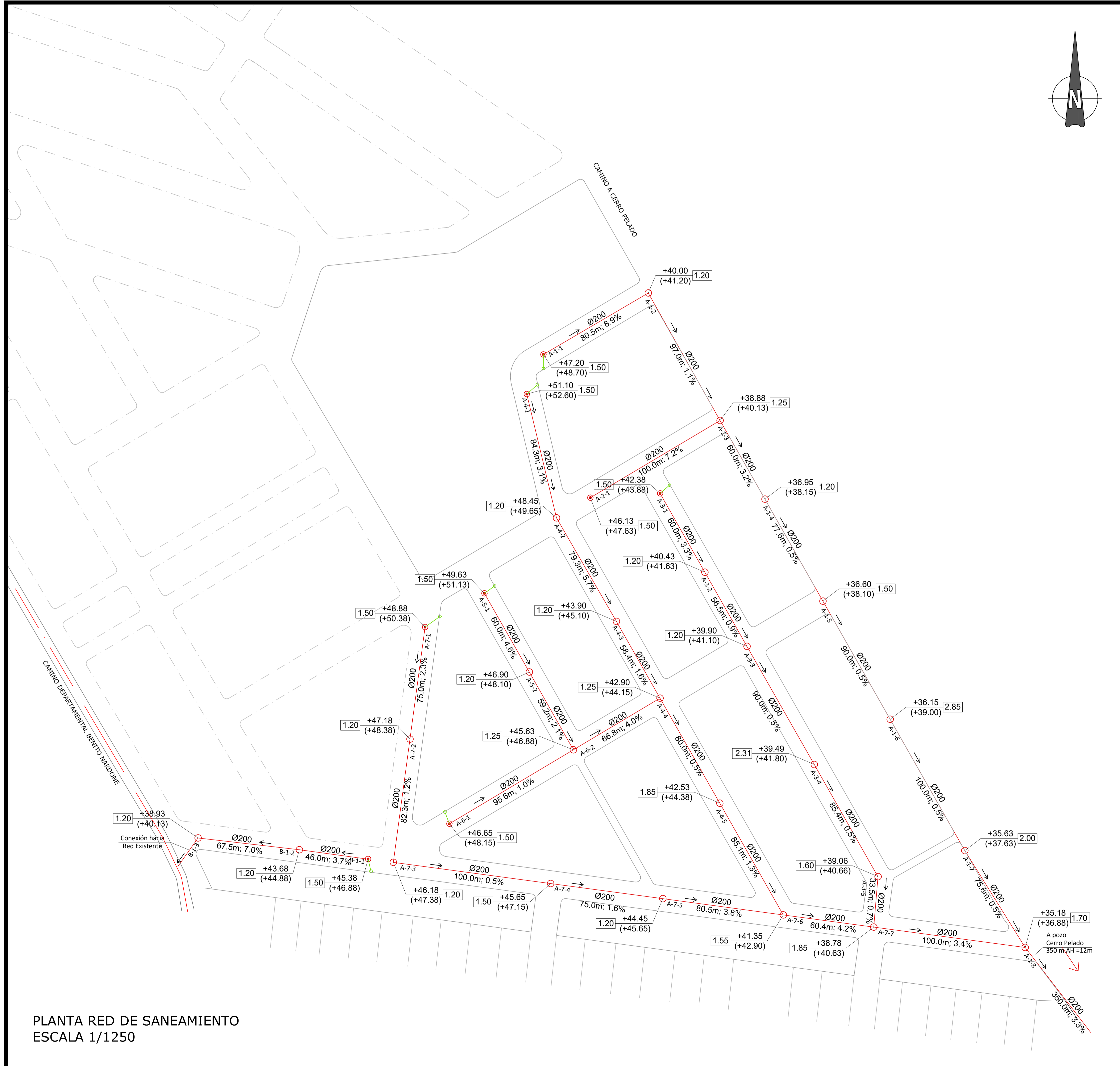
PLANTA RED DE SANEAMIENTO ESCALA 1/1250